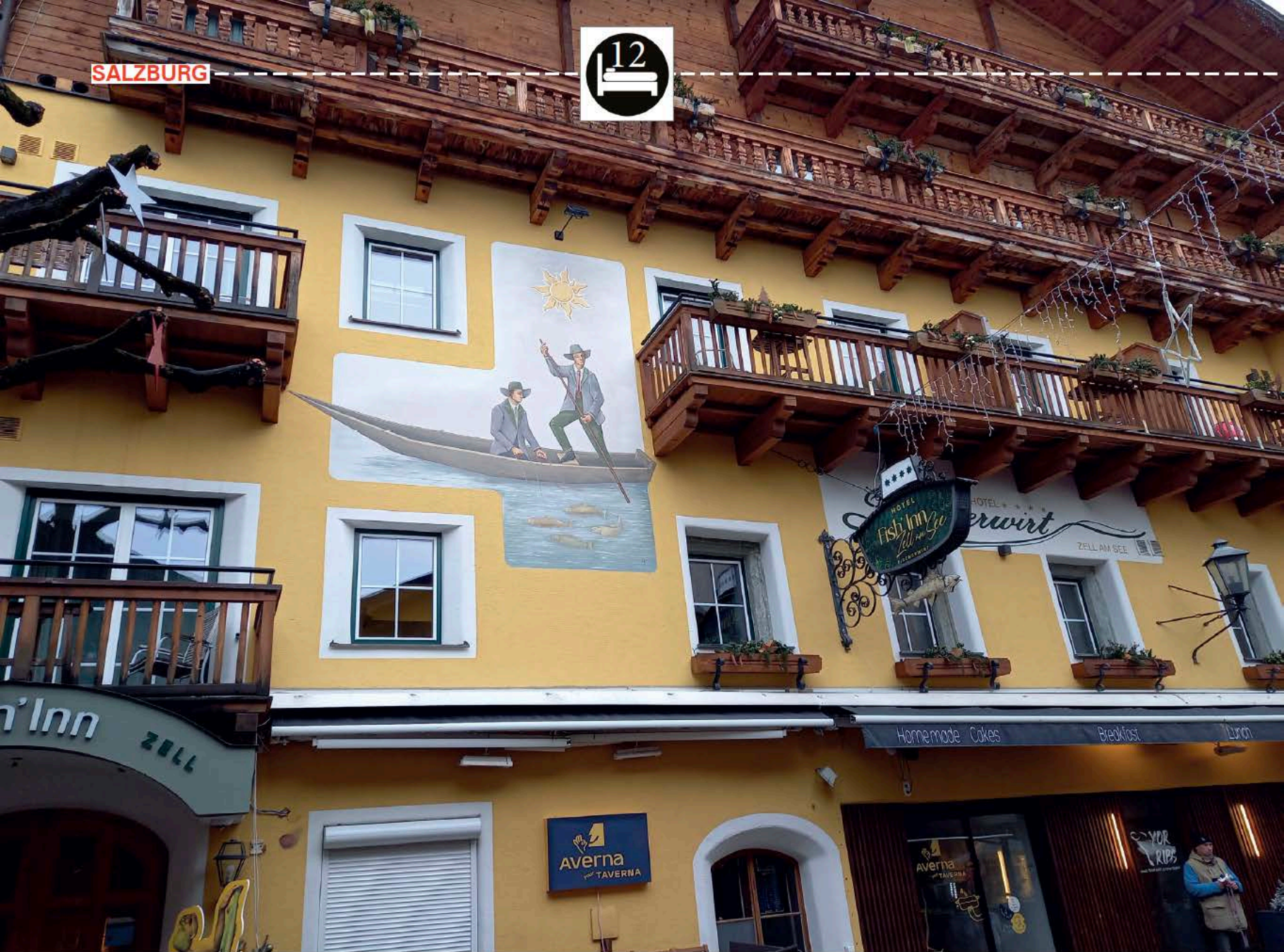
Das Hotel Fish'Inn in Zell am See.