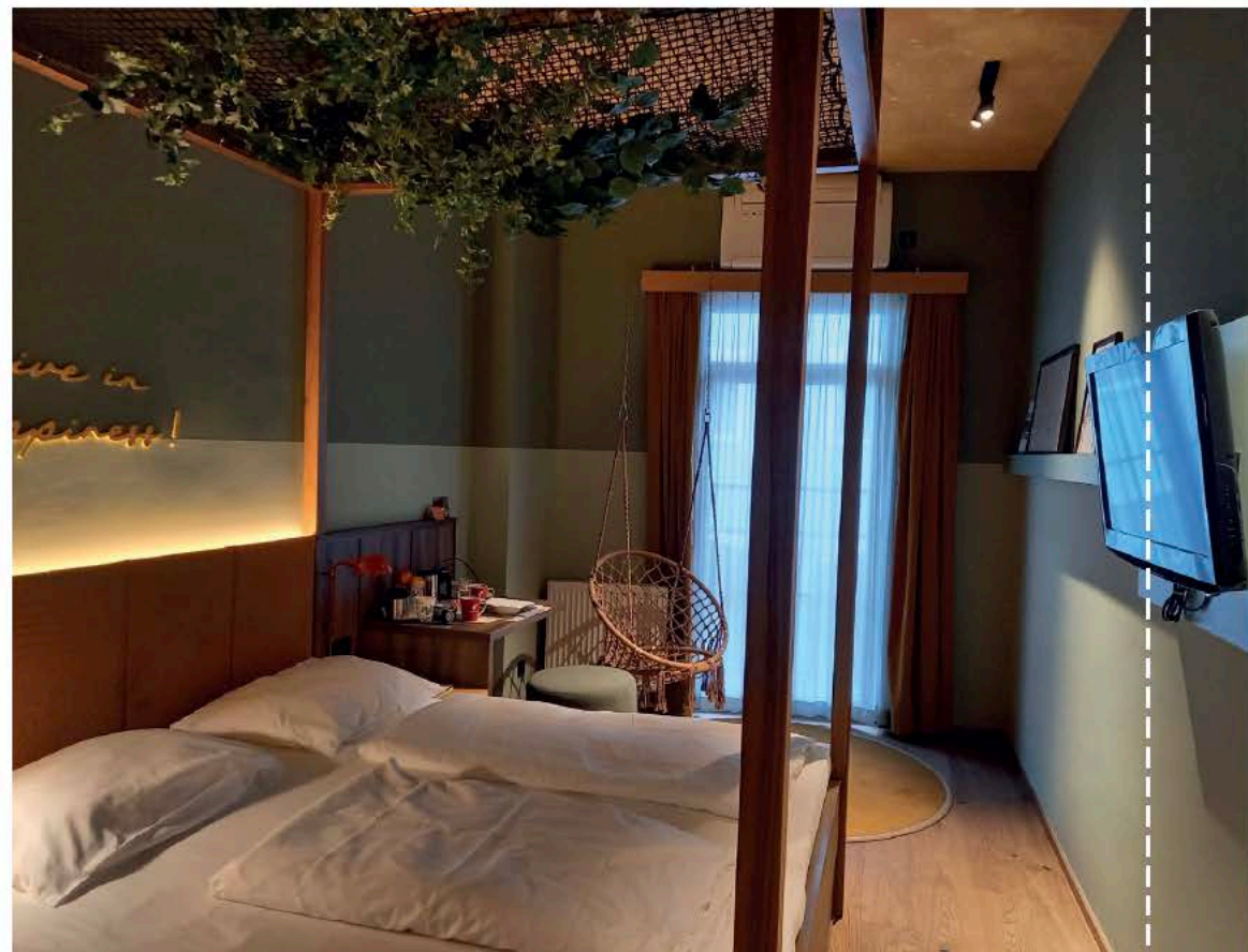
Klassik - Doppelzimmer.