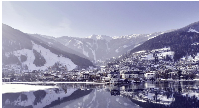
Die Stadt Zell am See wird eingerahmt vom Zeller See und dem Berg Schmittenhöhe.

Vor allem aber Skifahrer lockt die Region natürlich an: Das Gletscherskigebiet Kitzsteinhorn öffnet bereits im Oktober und garantiert damit Skigenuss vom Herbst bis in den Sommer hinein.